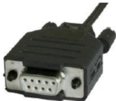
RS232 Isolator STD LWL 9Pin

Der RS232 Isolator STD LWL ist in 4 unterschiedlichen Kombinationen erhältlich, welche alle untereinander kombinierbar sind. Die Geräte sind mit einem patentierten Glasfaser Anschlussstecker ausgestattet, der es erlaubt, jede beliebige Kabellänge bis maximal 100 Meter herzustellen. Es werden keine Stecker, sondern lediglich ein scharfes Schnittwerkzeug zum Zuschneiden der LWL Kabel verwendet. Die konfektionierten Kabel werden einfach in die Umsetzer eingesteckt.