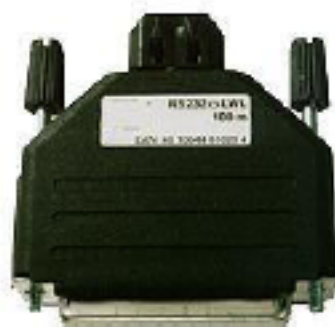
RS232 Isolator STD LWL 25Pin DCE